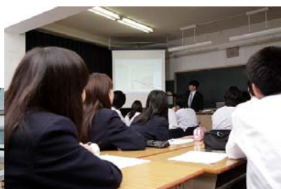
授業の様子（イメージ）