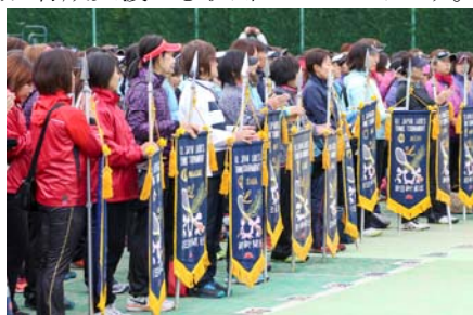
▲全国から厳しい予選を勝ち抜いた選手が集まります。

また、前回に引き続き一部地域にて、キッズ向けのテニスプログラム「TENNIS PLAY&STAY」を同時開催いたします。(岩手、福島、栃木、千葉、静岡、岐阜、広島、徳島、佐賀)「TENNIS PLAY&STAY」は幼稚園児～小学生低学年児童を対象に、ゲーム感覚で楽しくテニス体験できるプログラムです。当社は、このプログラムを通じて子どもたちへのテニス普及活動・育成支援にも取り組んでまいります。