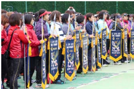
▲全国から厳しい予選を勝ち抜いた選手が集まります。

また、前回に引き続き一部地域にて、キッズ向けのテニスプログラム「TENNIS PLAY&STAY」を同時開催いたします。(岩手、福島、栃木、千葉、静岡、岐阜、広島、徳島、佐賀)「TENNIS PLAY&STAY」は幼稚園児～小学生低学年児童を対象に、ゲーム感覚で楽しくテニス体験できるプログラムです。当社は、このプログラムを通じて子どもたちへのテニス普及活動・育成支援にも取り組んでまいります。