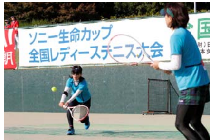
▲連日会場では熱戦が繰り広げられます。